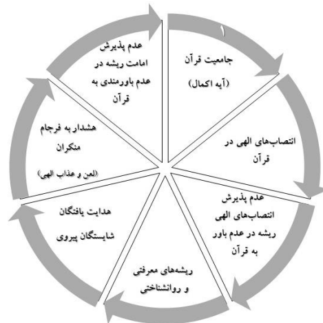
شکل ۲. مدل مفهومی الگوی نظری و معرفتی اقتباس‌های قرآنی در کلام امام رضا (ع)

به نظر می‌رسد الگوی نظری ویژه‌ای بر اقتباس‌های قرآنی حضرت امام رضا (ع) در ریشه‌شناسی اختلاف مردم در امر امامت حاکم است. حضرت (ع) در ابتدا به «جهل» و «فریب خوردن مردم در دین» اشاره و سپس به «جامعیت قرآن» و پیوند آن با «اکمال دین» و تعیین رهبری جامعه اسلامی بعد از پیامبر خاتم (ص) بر اساس انتصاب الهی پرداختند.